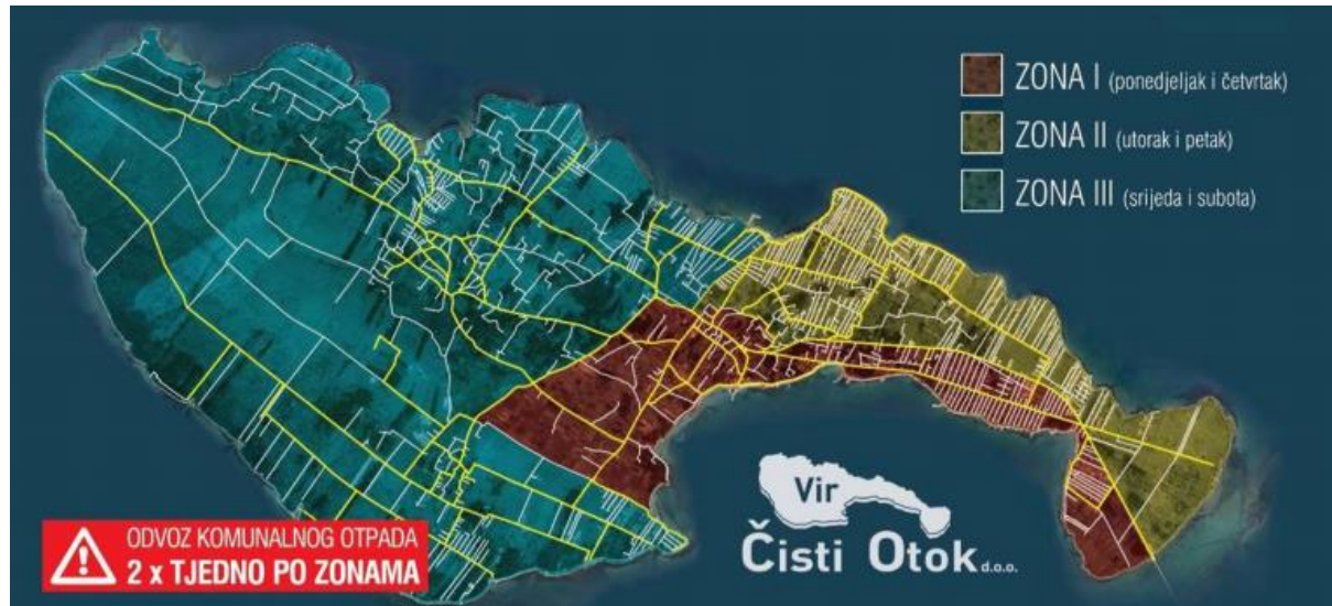
Slika 1. Odvoz komunalnog otpada

Prikupljanje miješanog komunalnog otpada obavlja se prema unaprijed utvrđenom kalendaru odvoza (2 x tjedno), vlastitim voznim parkom, putem spremnika zapremine 120 l, 240 l i 1.100 l (slika u nastavku).